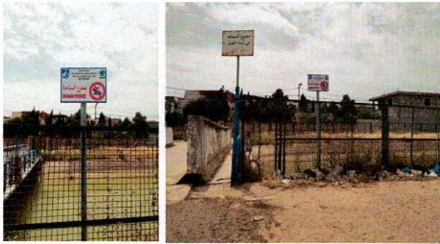
علامات منع السباحة

تقوم شركة استغلال قنال وأنابيب مياه الشمال بتركيز وتجديد لافتات على ضفتي القنال لمنع من السباحة والقاء الفضلات كما تقوم بالتنسيق مع البلديات التي يمر عبرها القنال قصد تحديد أماكن التدخل ذات الأولوية لتسييجها وتركيز العلامات التحذيرية. كما تقوم الشركة سنويا بتوزيع وتركيز لافتات منع السباحة ومنع القاء الفضلات على مستوى البلديات