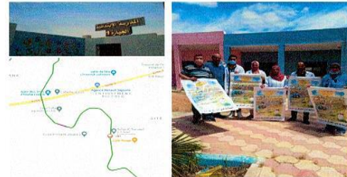
حملة تحسيسية بالمدرسة الابتدائية بالجيرة 1

يتم سنويا القيام بحملات تحسيسية بالمدارس التربوية المحاذية للقنال قصد تحسيس وتوعية التلاميذ بمخاطر السباحة بالقنال واهمية هذه المنشأة في التزود بمياه الشرب والري وضرورة المحافظة عليه