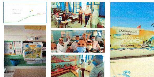
حملة تحسيسية بالمدرسة الابتدائية بطليلش